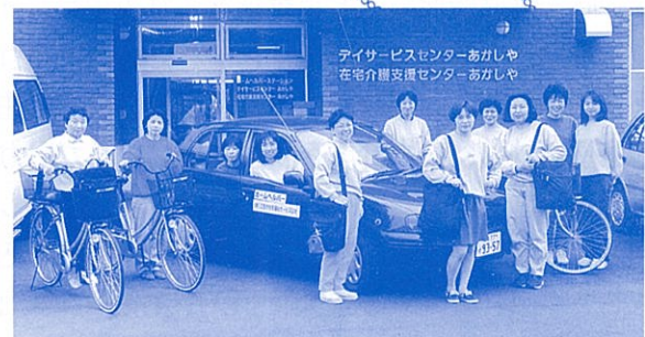
ヘルパーステーション あかしゃ