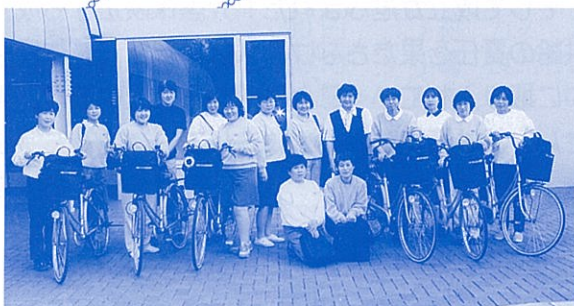
ヘルパーステーション いきいき