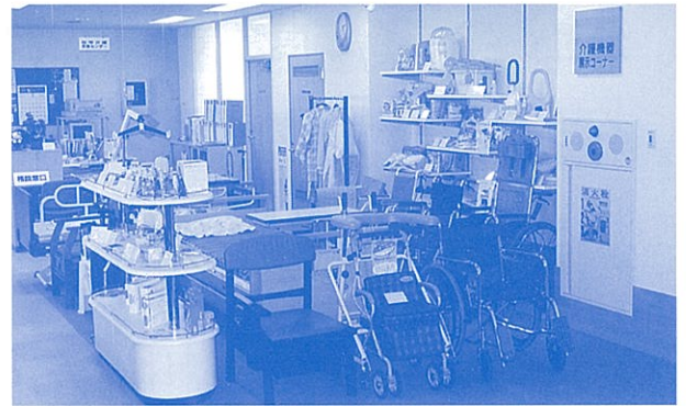
介護機器展示コーナー